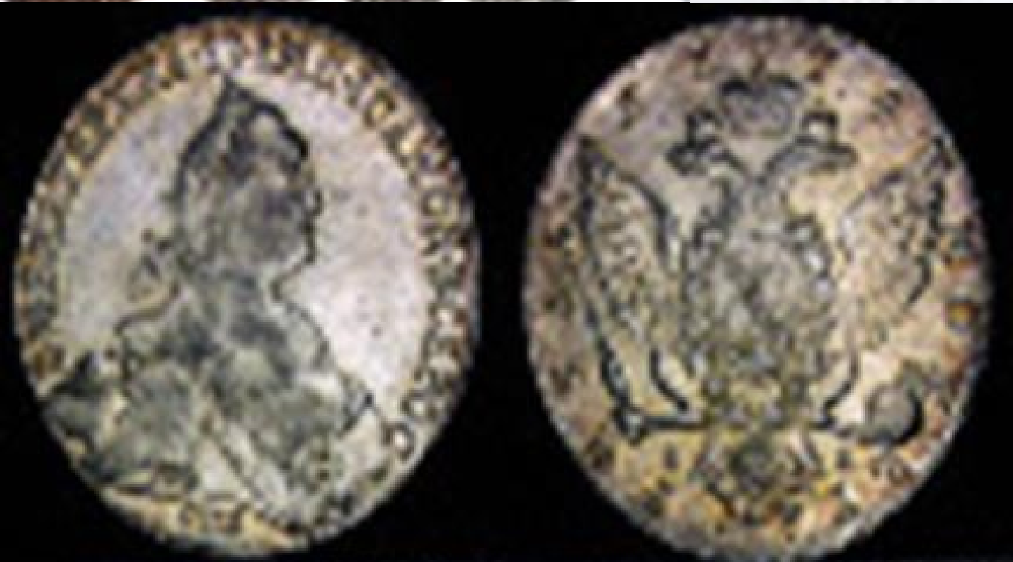
Приложение №10. Монеты XVIII века.