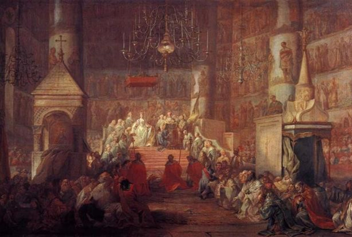
Приложение №14. Коронование Екатерины II 22 сентября 1762 года.