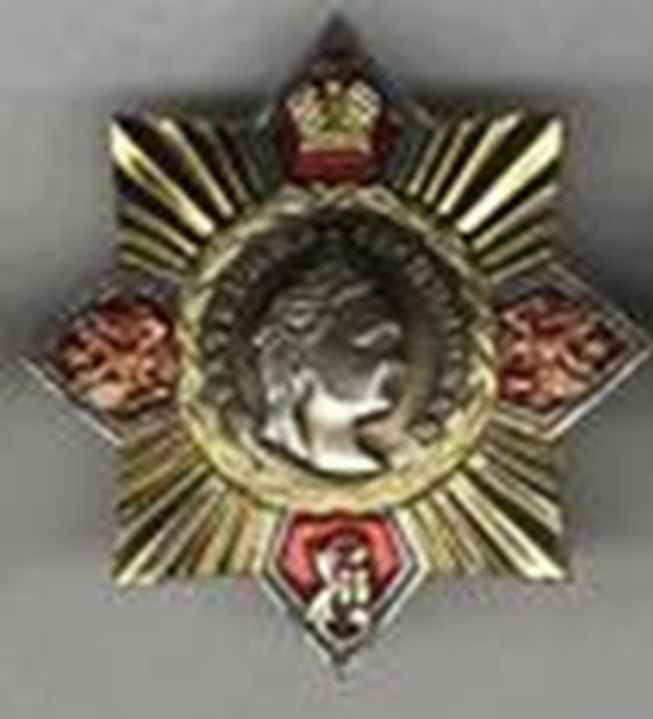
Приложение №11. Орден Екатерины Великой.