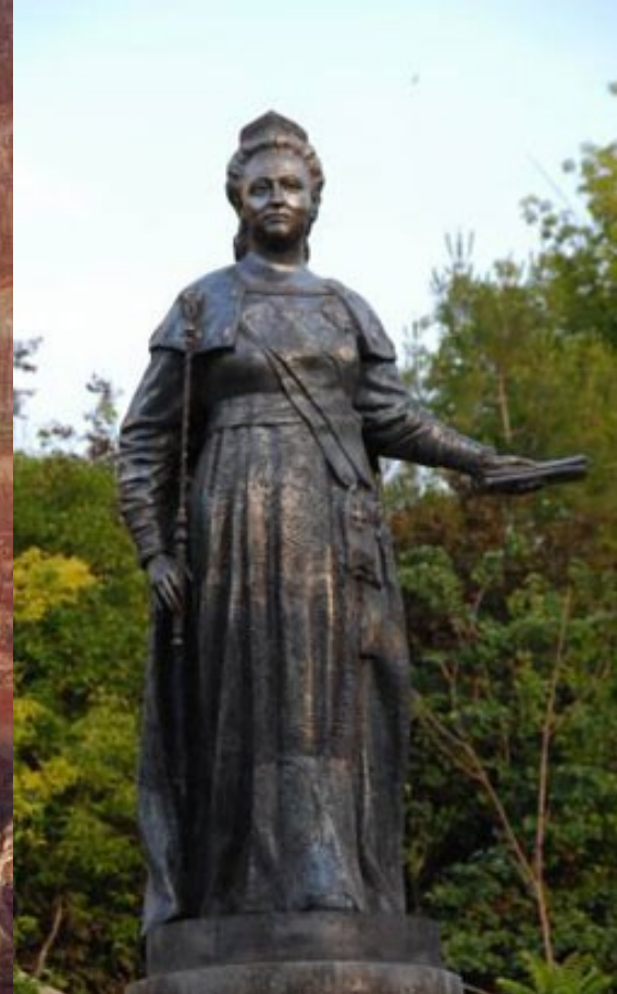
Приложение №15. Памятник Екатерине II.