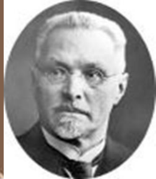
В. О. Ключевский