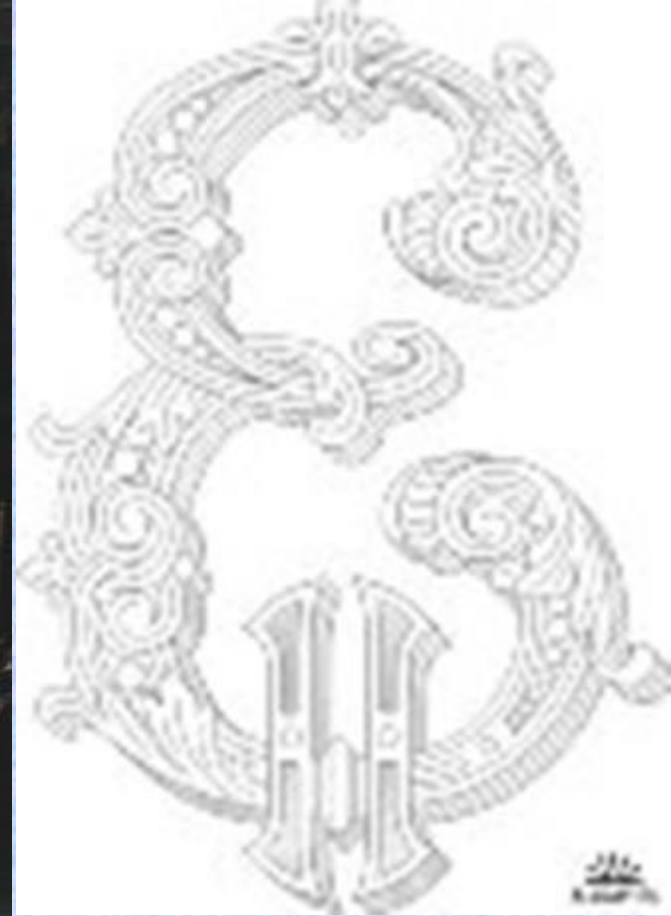
Приложение №6. Вензель Екатерины II.