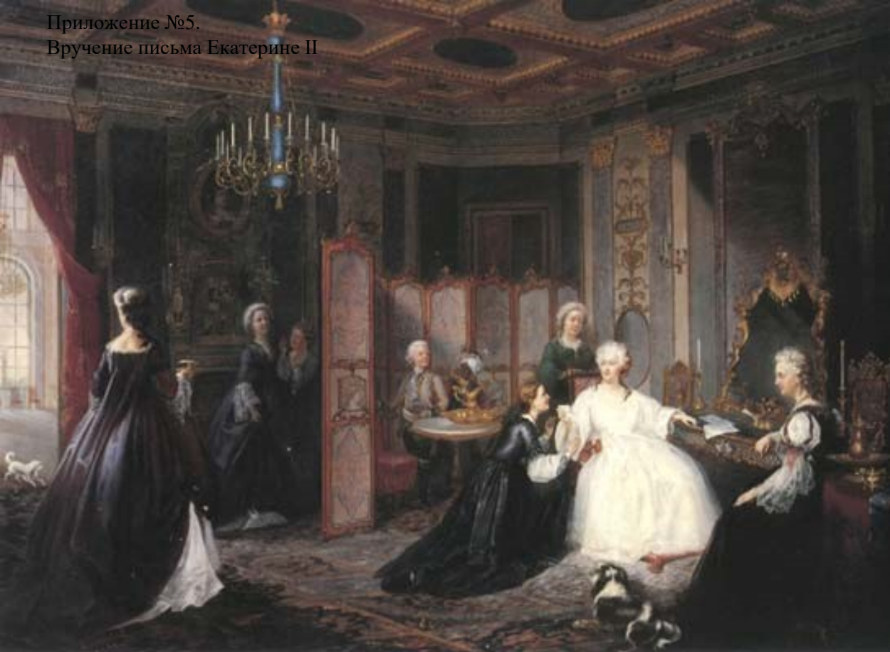
Приложение №5. Вручение письма Екатерине II