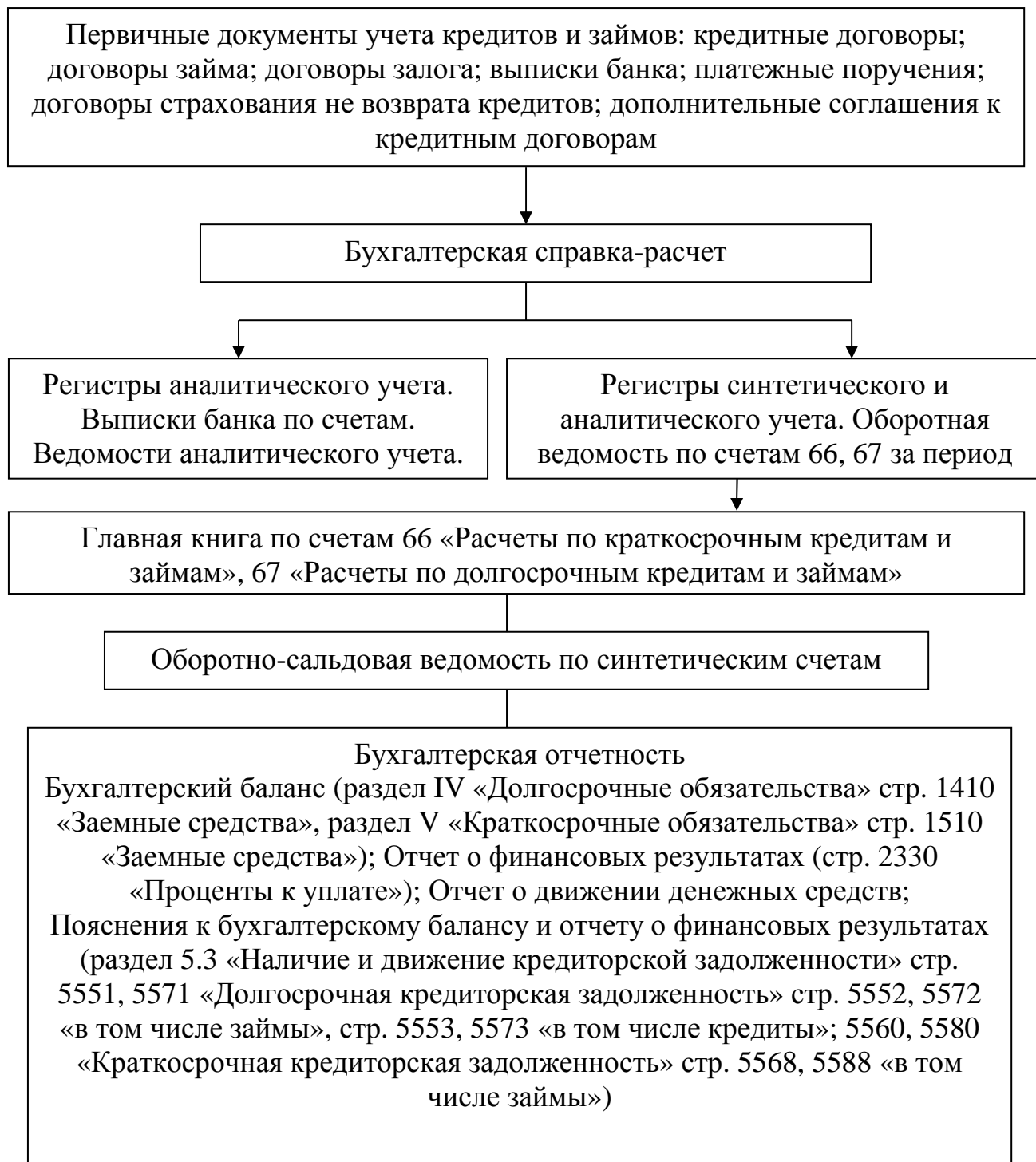
Рисунок Ж.2 – Документальное оформление учета заемного капитала в ООО «Луч»