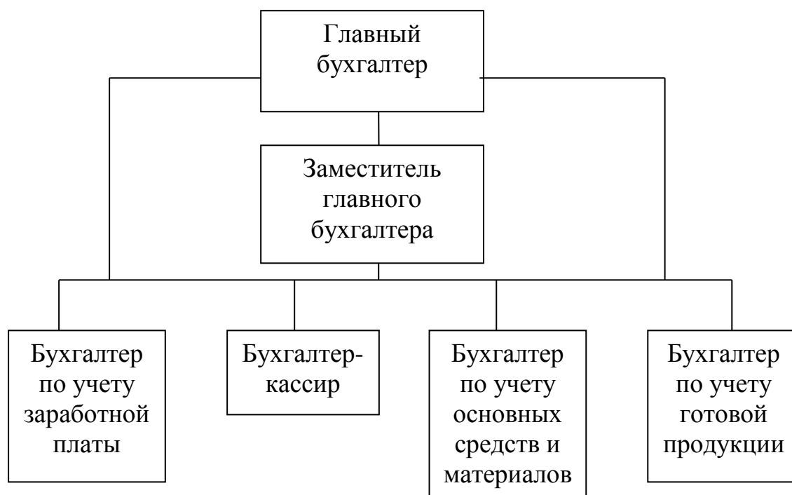
Рисунок Д.2 – Структура аппарата бухгалтерии ООО «Луч»