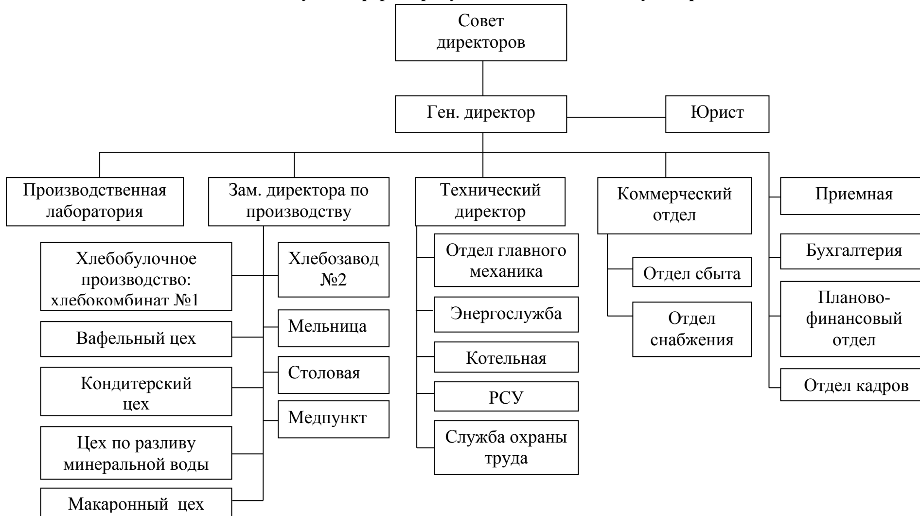
Рисунок Д.1 – Организационная структура управления ООО «Луч»