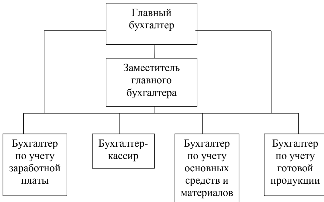
Рисунок Д.2 – Структура аппарата бухгалтерии ООО «Луч»